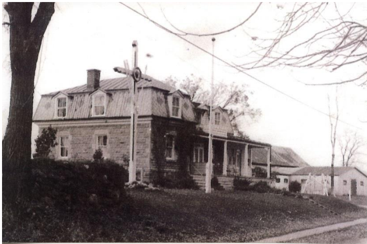
Maison Napoléon-Boileau, fils de Jules. Photo c. 1940.