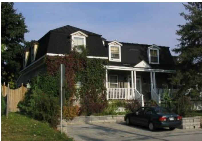
Maison Napoléon-Boileau, fils de Jules.