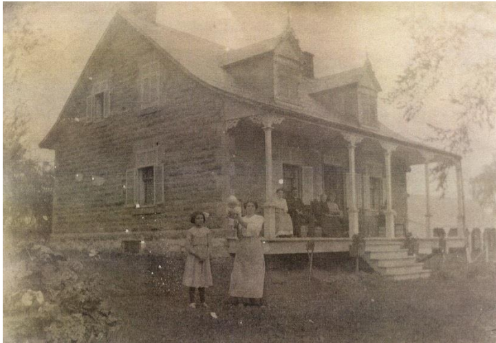
Maison Napoléon-Boileau, fils de Jules. Photo c. 1913.