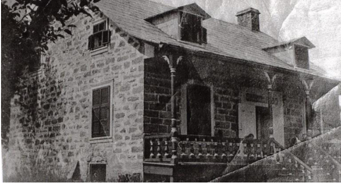
Maison Hyacinthe-Paquin, construite en 1839. Photo c. 1910.