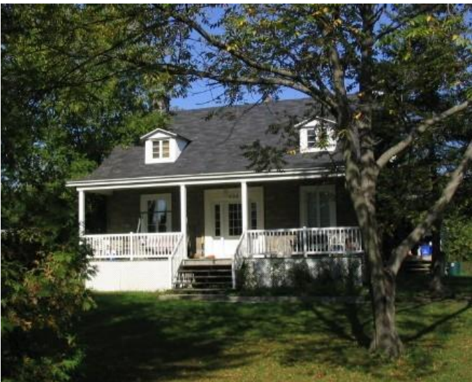
Maison Hyacinthe-Paquin, construite en 1839. Photo Roger Labastrou, 2007.