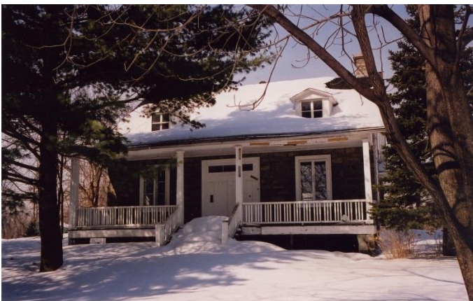
Maison Hyacinthe-Paquin, construite en 1839.