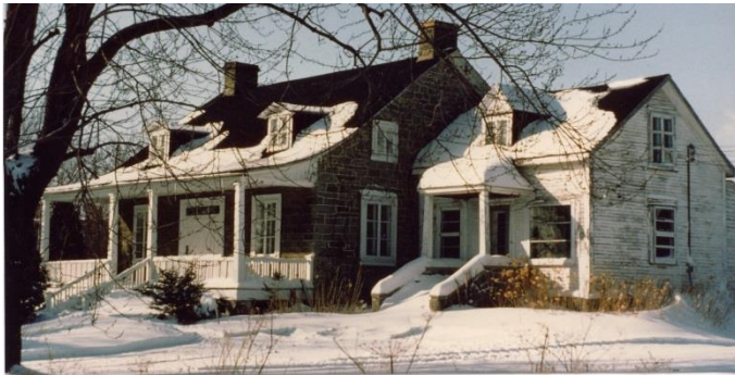
Maison Hyacinthe-Paquin, construite en 1839. Photo Raymond Jotterand, 1975.