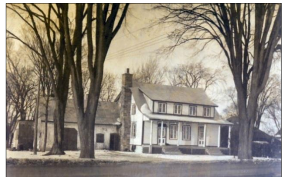
Maison Louis-Théoret, 14945, boulevard Gouin Ouest, Sainte-Genève. Photo de 1956.