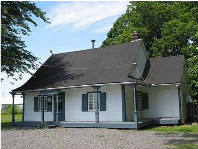
Maison du Centenaire. Photo Anne Colette, 2007.