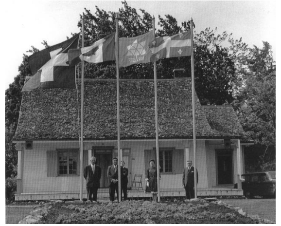
Maison du Centenaire lors de son inauguration après rénovation par la Chambre de commerce de l'île Bizard. Auteur inconnu, 1967.