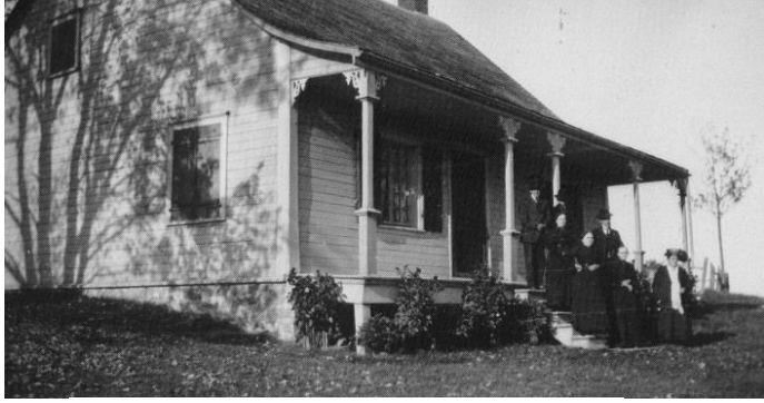
Famille Proulx devant leur maison. Auteur inconnu, vers 1910.