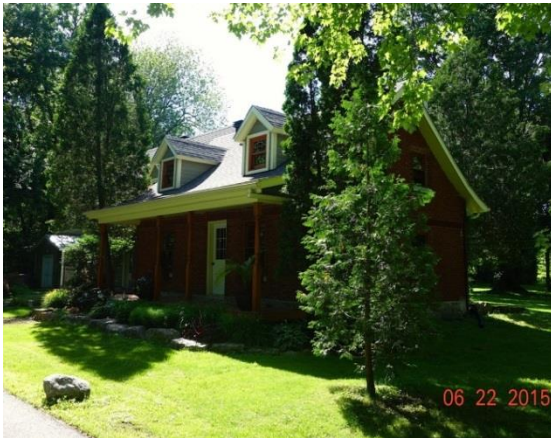
Maison Noël-Wilson, façade sud et pignon, après restauration. Photo André Wilson, 2015.