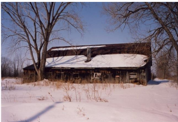
Grange de ferme de Noël Wilson. Photo Bernard Pouliot, 2001.