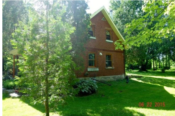
Maison Noël-Wilson avec son annexe. Photo André Wilson, 2015.