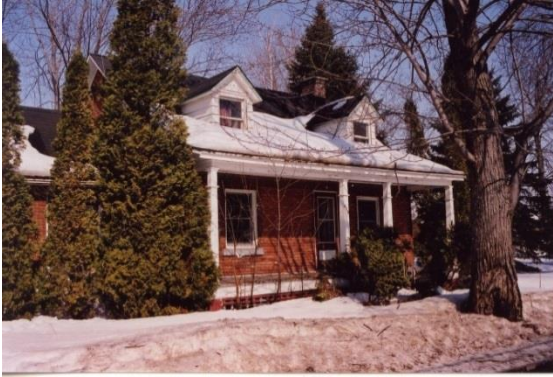
Maison Noël-Wilson, avant restauration.