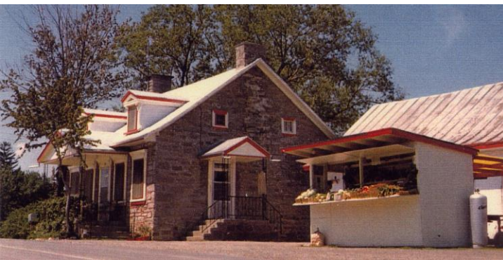
Maison Martin-Paquin avec kiosque de fruits et légumes. Auteur inconnu, c. 1970-1975.