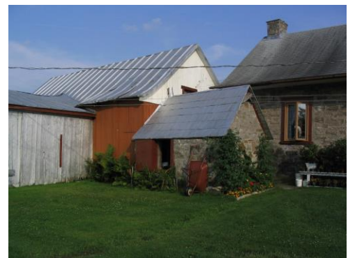
Laiterie et bâtiments de ferme à l'arrière de la maison. Photo Roger Labastrou, 2007.