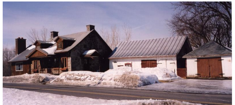
Maison Martin-Paquin avec l'annexe de 1977 et les granges. Photo Bernard Pouliot, 2001.