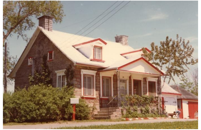
Maison Martin-Paquin. Photo R. Jotterand, 1975.