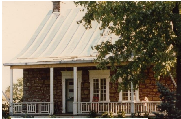
Maison Joseph-Théoret, façade nord.