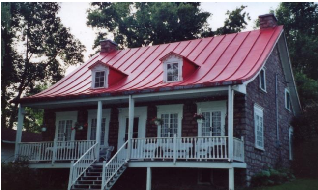
Maison Joseph-Théoret, façade sud.