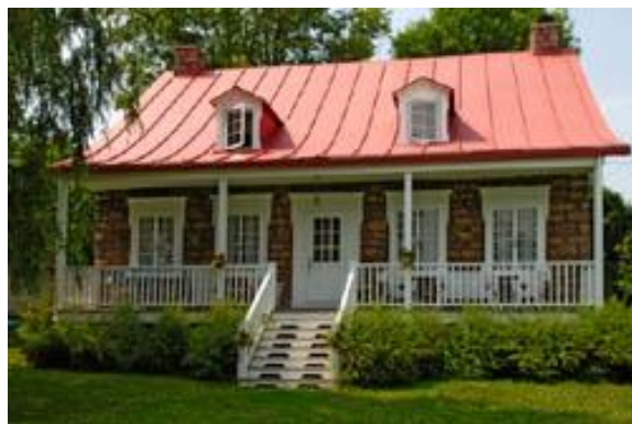
Photo Opération patrimoine architectural de Montréal. Façade sud. Photo 2005.