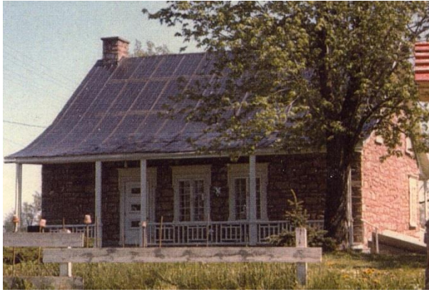
Maison Joseph-Théoret, façade nord. Photo Raymond Jotterand, 1975.