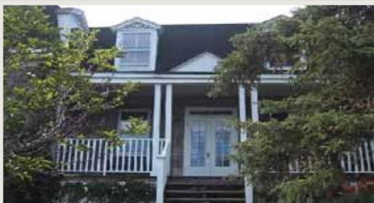
Maison napoléon-Boileau 659, rue Cherrier

1) société du Patrimoine de l'Ouest-de-l'Île