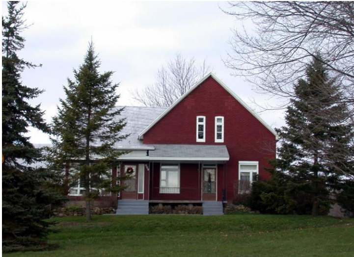
Maison de Gérard Joly, 809, rue Cherrier. Photo R. Labastrou, 2007.