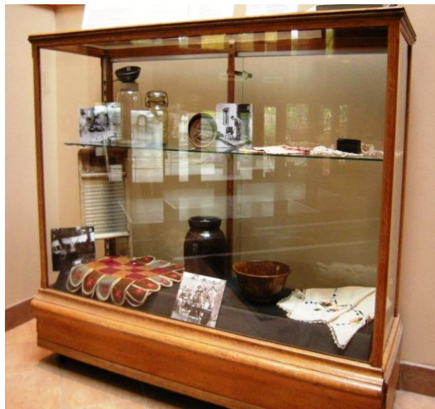
La vitrine à l'entrée principale de la bibliothèque