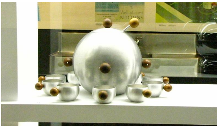
Bol à punch des années 1940.

Cette exposition se terminera le 14 avril 2013. Voici deux photos prises lors de notre visite :