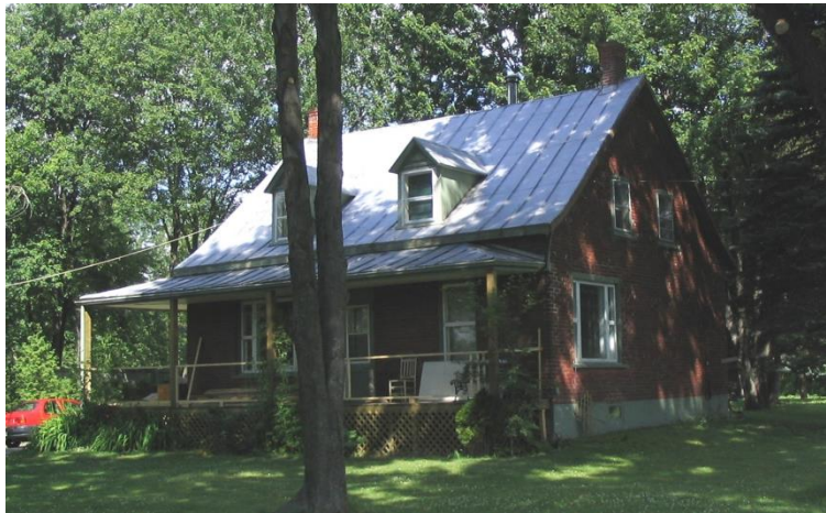
Maison Jean-Baptiste Brunet avant enlèvement du parement de brique. Photo Roger Labastrou, 2007.