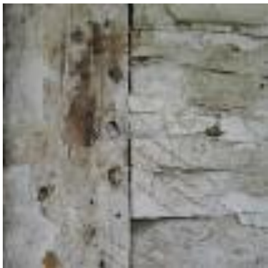
Assemblage à chevilles de bois, avec traits de charpentier. Photos Roger Labastrou, 2008.