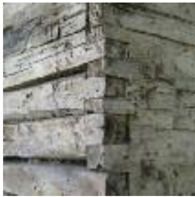
Coin de façade. Assemblage à mi-bois.