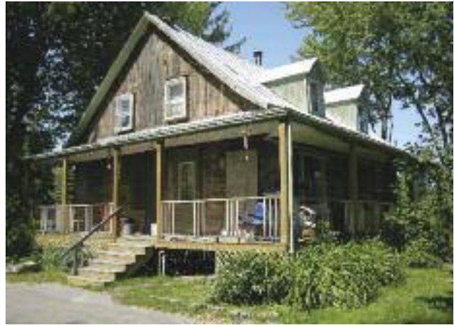
Maison Jean-Baptiste Brunet après enlèvement du parement de brique en 2008.