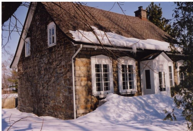
Maison François-Lalonde avec tambour à l'entrée sud.. Photo Bernard Pouliot, 2001.