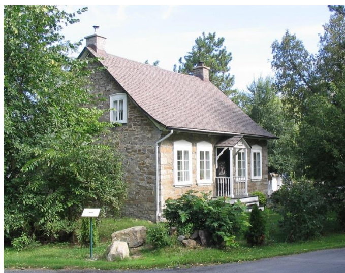
Maison François-Lalonde. Photo Roger Labastrou, 2007.