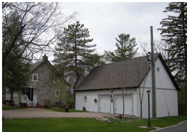
Maison François-Lalonde avec sa remise restaurée. 2016.