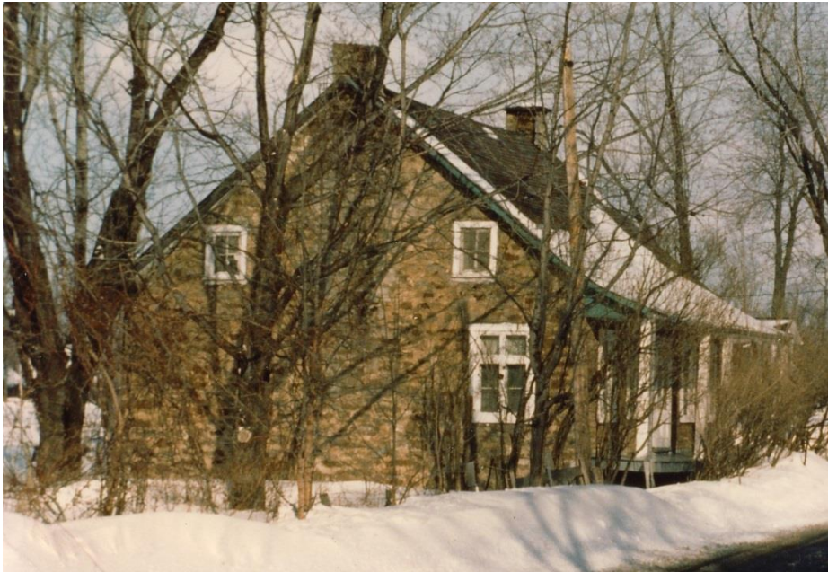
Maison Eustache Brayer dit Saint-Pierre.. Photo Raymond Jotterand, 1975.