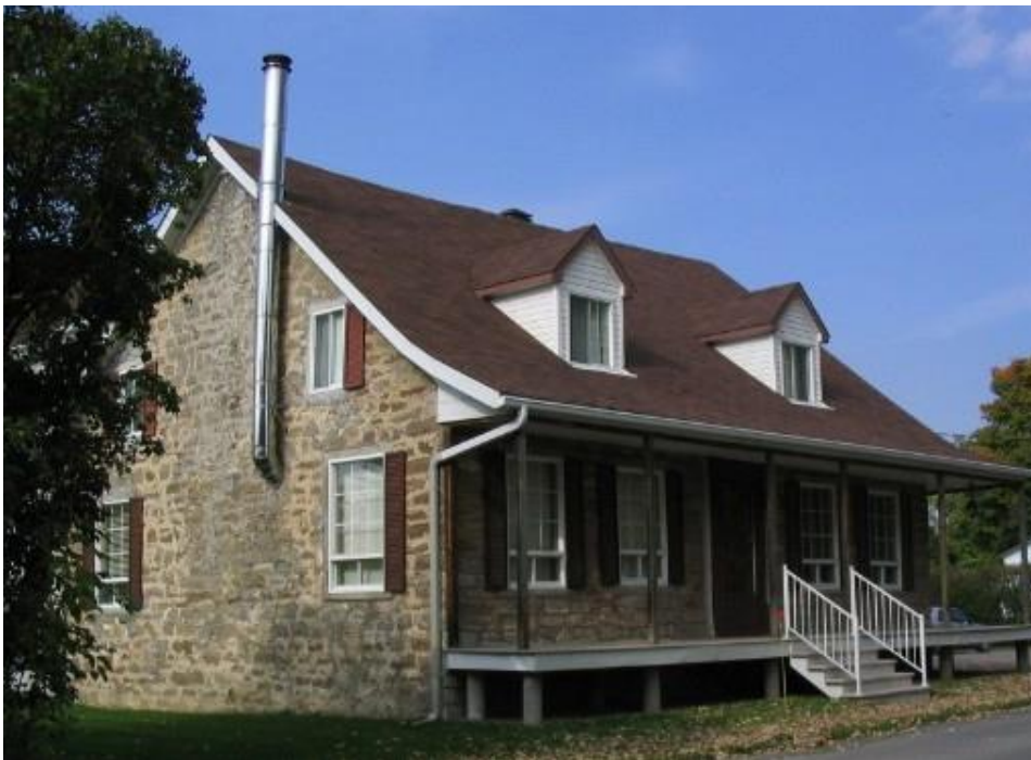
Maison Eustache Brayer dit Saint-Pierre. Photo Roger Labastrou, 2007.