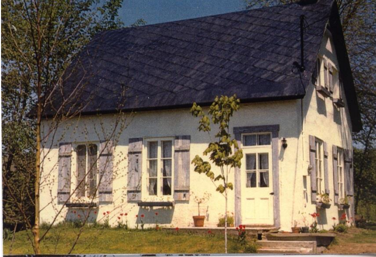
Ancienne école du Cap. Photo Raymond Jotterand, 1975.