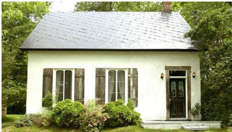
Ancienne école du Cap, sans auvent. Photo Opération Patrimoine architectural de Montréal, 2002.