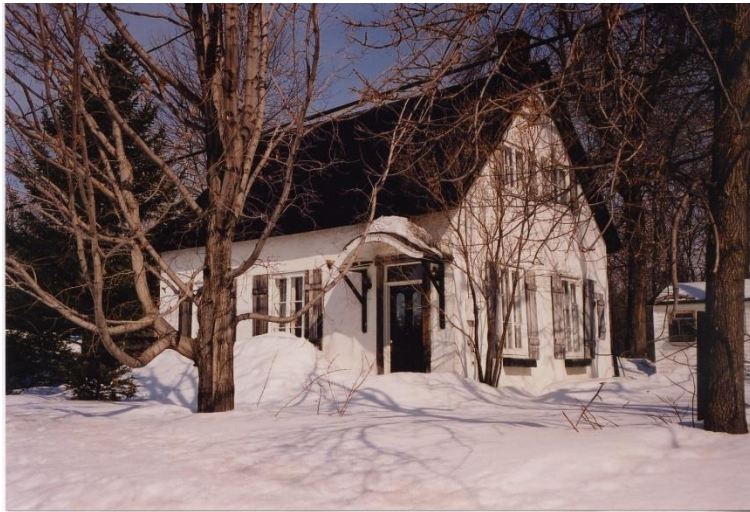
Ancienne école du Cap, avec auvent au-dessus de la porte. Photo Bernard Pouliot, 2001.