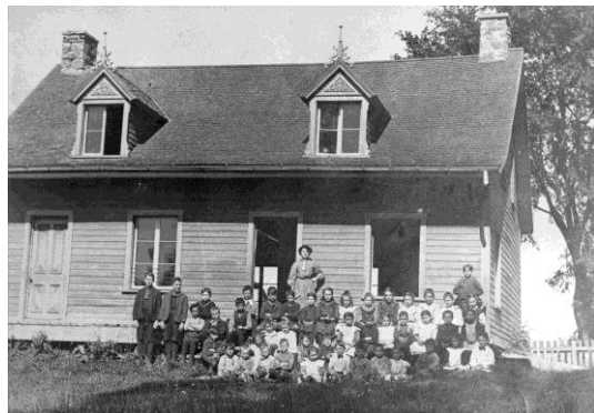
Ancienne école du village, maintenant diminuée de moitié et devenue résidence privée, 320, rue de l'Église..

Le regroupement des élèves au village eut lieu en 1957, dans la nouvelle école Saint-Raphaël, mais dès 1960, celle-ci devint insuffisante et il fallut construire une nouvelle école adjacente, l'école Sainte-Thérèse. Ces deux bâtiments sont maintenant réunis par un gymnase et ont pris ensemble le nom d'école Jacques-Bizard. Avec l'affluence de nouveaux résidents dans l'est de l'île, l'école Jonathan Wilson s'est ajoutée en 1986. Cependant, il n'y a jamais eu d'école secondaire dans l'île et, après le primaire, les élèves doivent fréquenter les écoles secondaires de la région.