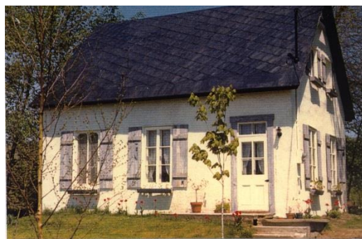
Ancienne école du Cap, 1255, montée Wilson. Maintenant résidence privée.