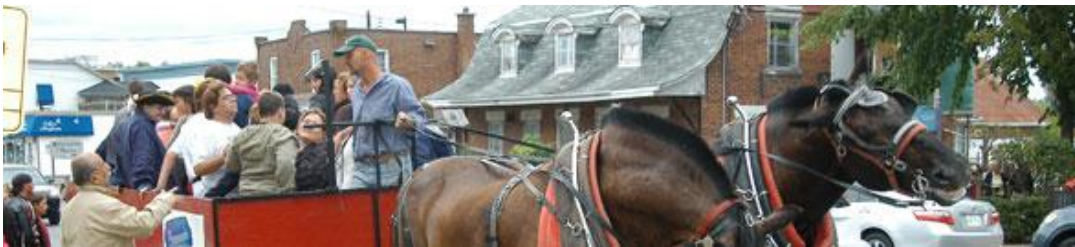
Des participants à la visite guidée en 2008.