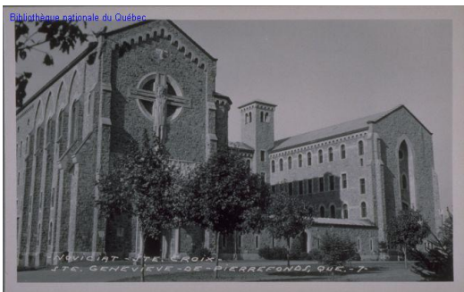
Le cégep Gérard-Godin, à l'époque où c'était le monastère des pères de Sainte-Croix.