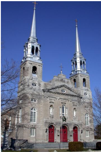
L'église de Sainte-Genève

La conférence aura lieu au collège Gérald-Godin, au 15615, boul. Gouin Ouest, Sainte-Genève. Entrée gratuite.