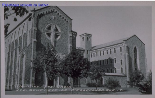
Monastère des Pères de Sainte-Croix (maintenant le Collège Gérald-Godin)